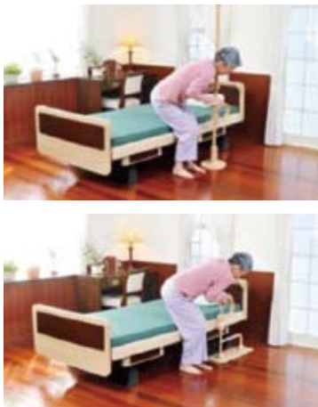
立ち上がり時に使用

A2 丈夫で、簡単に設置可能な手すりがあります!! 【商品：パディー】 様々な用途に応じて形式に種類があります。介護保険レンタル対象になります。